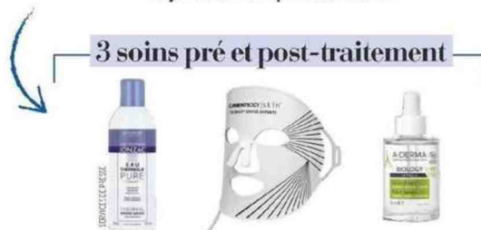
Eau Thermale. Pure, 300 ml, 7,60 €, Jonzac . Masque de photothérapie. LED, 329 €, Current Body . Sérum. 3-en-1 Biology Hyalu, 30 ml, 21,90 €, A-Derma .